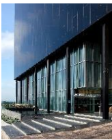
AC by Marriott Querétaro