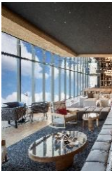
Live Aqua Monterrey Valle