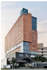
AC by Marriott Veracruz