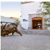
Live Aqua San Miguel de Allende